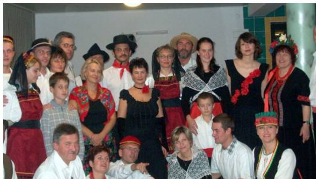
Kudova- Cena Clausura