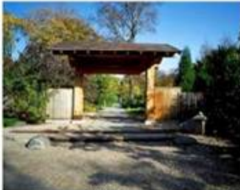
El jardín japonés