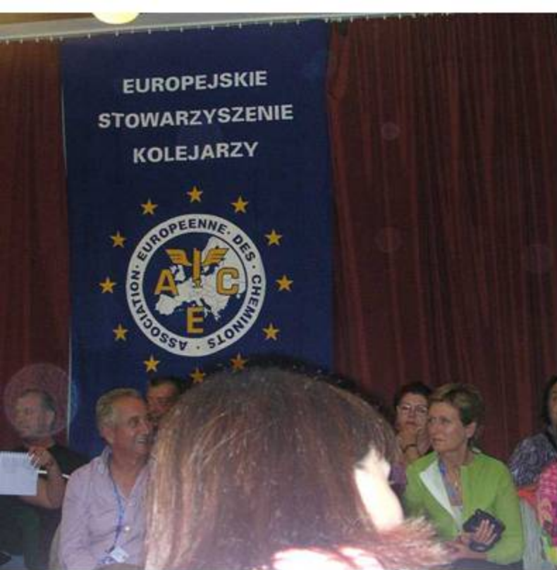
KUDOVA-Cena Gala de Apertura