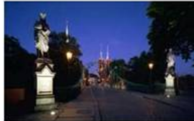
El Puente Tumski

Wrocław en el cruce del rutas comerciales de Alemania a Russia hacia Mar Negro y de Venezia a Mar Baltic. siempre fue centro del comercio, ideas y hombres. Del XI siglo fue como una de las capitales del estado polaco y después como capital del principado silesiano, gobernado por la dinasta Piastos. En XIV y XV siglo gobernada por reyes checos cuando fueron construidos edificios góticos iglesias y el ayuntamiento.