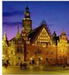
El Ayuntamiento Viejo