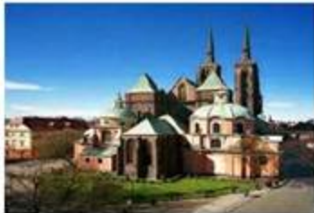
Catedral de S.Juan Bautista en la isla Ostrów Tumski